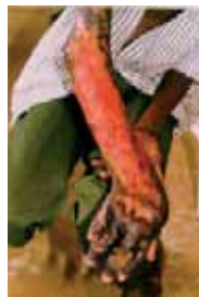
Vaste Ulcère de Buruli