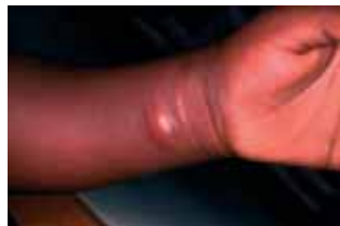
Début de la maladie Nodule